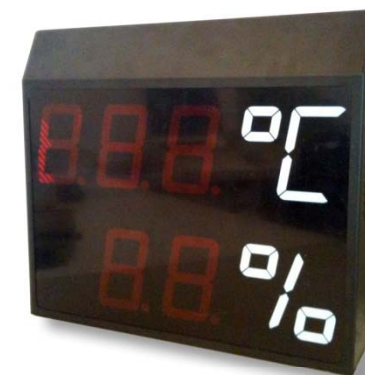
Funciona como visualizador, sin sondas integradas