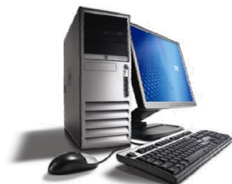
Sistema de supervisión Telegestión