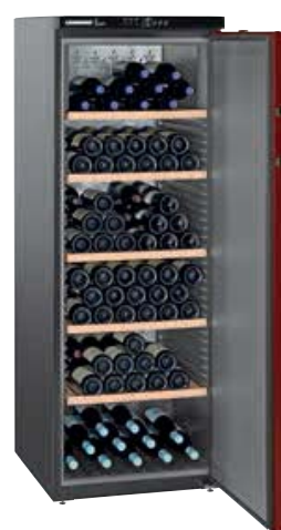
WTr 4211 VINO THEK