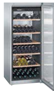
WKes 4552 GRAND CRU