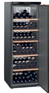
WKr 4211 VINO THEK