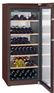
WKt 4552 GRAND CRU