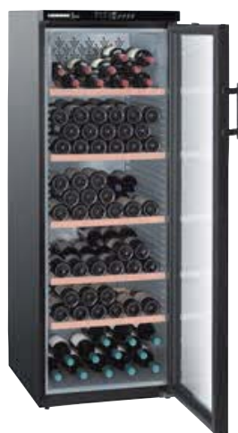
WTb 4212 VINO THEK