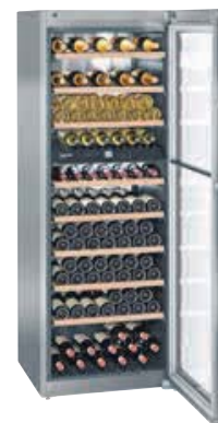
WTes 5972 VINIDOR

INOX 40 BOTELLAS 75 cc. LIBRE INSTALACIÓN