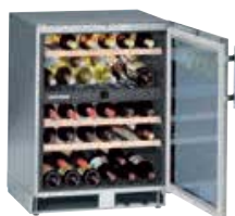
WTUes 1653 VINIDOR

INOX 38 BOTELLAS 75 cc. EMPOTRABLE. BAJO ENCIMERA