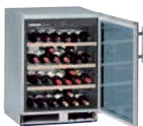
WKUes 1753 GRAND CRU