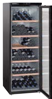
WKb 4212 VINO THEK