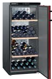
WKr 3211 VINO THEK