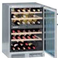
WTes 1753 VINIDOR

INOX 38 BOTELLAS 75 cc. EMPOTRABLE. BAJO ENCIMERA