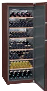
WKt 5551 GRAND CRU