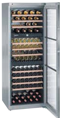
WTes 5872 VINIDOR