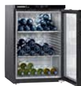
WKb 1812 VINO THEK