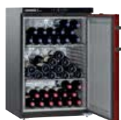
WKr 1811 VINO THEK