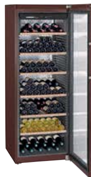
WKt 5552 GRAND CRU