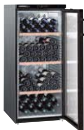
WKb 3212 VINO THEK