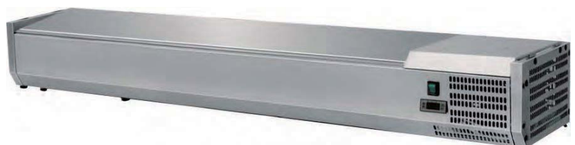
EPI-200-T CUBIERTA INOX