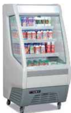
SANDWICH - M-80