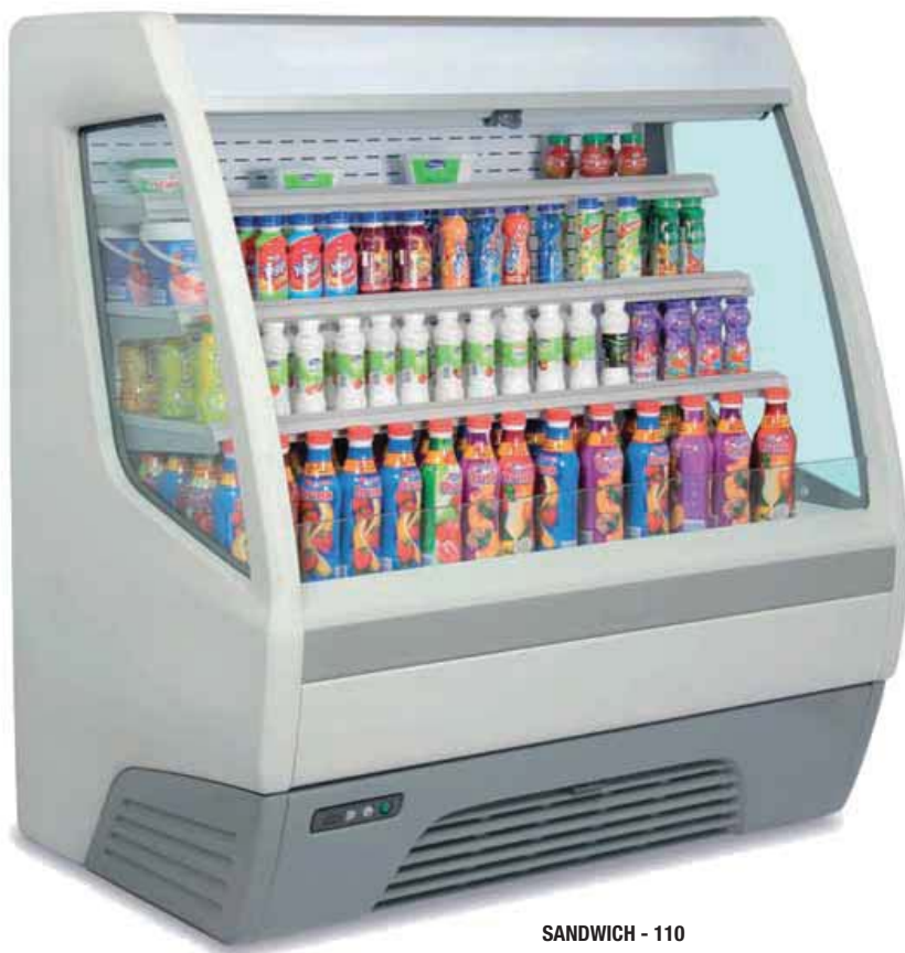
SANDWICH - 110