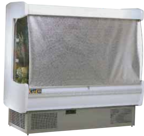
CON CORTINA INCORPORADA