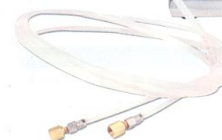
FLUSH 1 PLUS HVAC