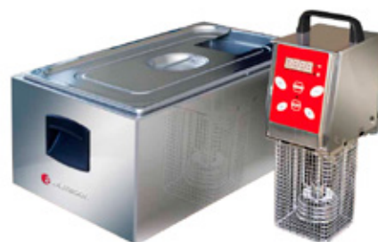
RONER SOUS VIDE COOKER

Bandejas no incluidas. Se venden por separado.