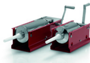
MODELO L ECO