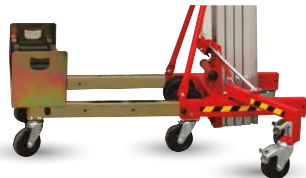
Montaje patas en parte trasera con soporte y contrapesas