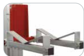
Adaptador para cargas diseño curvo