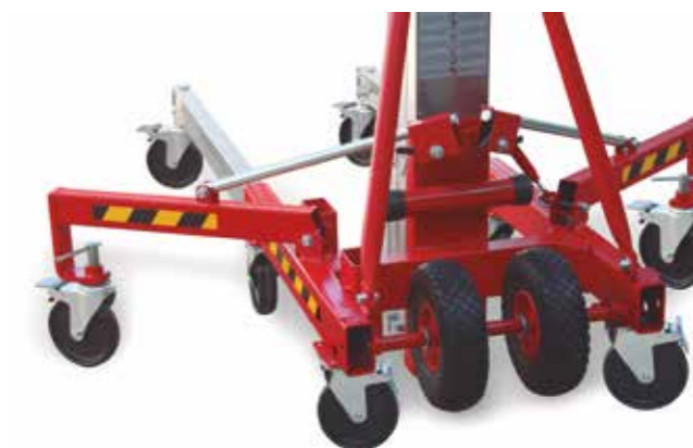
Estabilizadores laterales abatibles y desmontables

ELEVADORES SERIE W-200 PARA OTRAS ALTURAS Y CARGAS, CONSULTAR