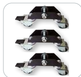
Kit ruedas opcional