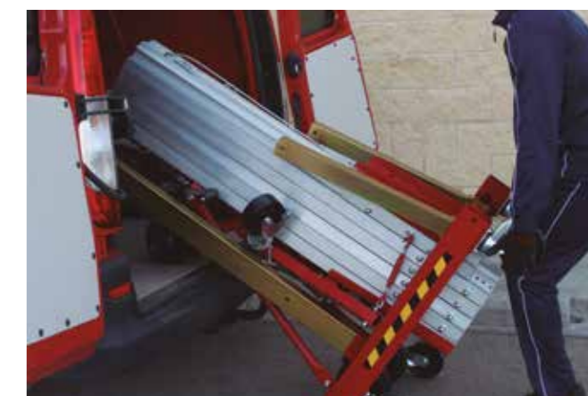
Posibilidad de carga en vehículo