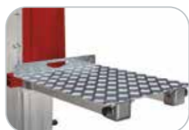
Bandeja para horquillas 630x500 mm